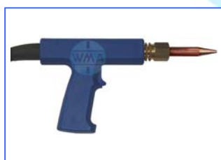
Pistole PP1/K Bestellnummer: XR1.401.035B000