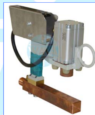
pneumatische Massepolklemme Bestellnummer: XR1.401.026B000