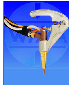
Pistole PP6 Bestellnummer: XR1.401.008