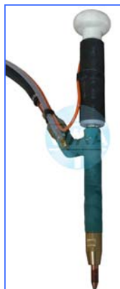
Pistole PP8 Bestellnummer: XR1.401.25B000