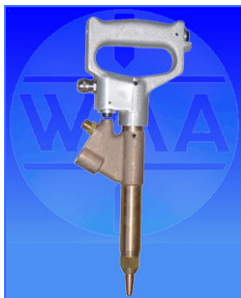
Pistole PP5 Bestellnummer: XR1.401.003