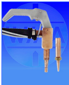
Pistole PP1 wasser- oder luftgekühlt Bestellnummer: XR1.401.000