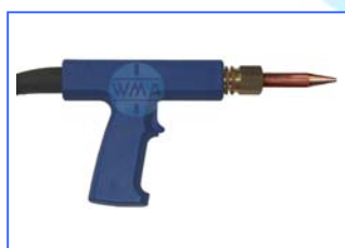
Pistole PP1/K Bestellnummer: XR1.401.035B000